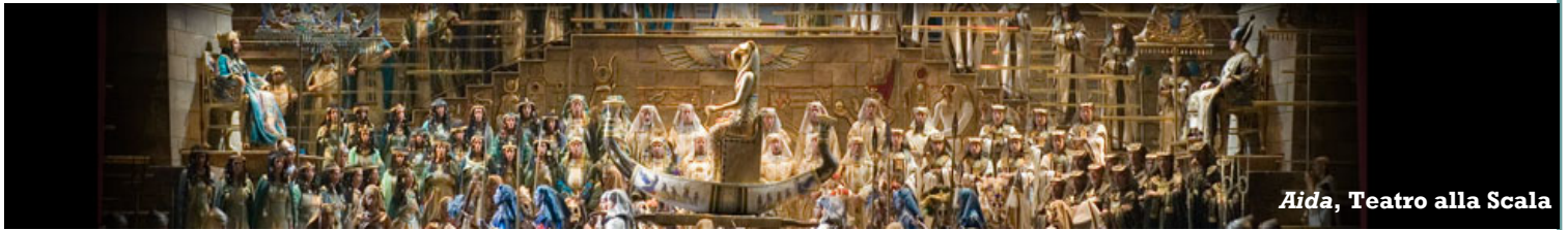
Aida, Teatro alla Scala