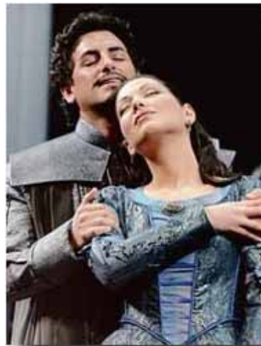
Juan Diego Flórez, Arturo Nino Machaidze, Elvira in I puritani , Bologna, gennaio 2009

ma già di grande fama internazionale e da un direttore d’orchestra, Michele Mariotti, non ancora trentenne ma già Direttore Principale. Il tenore, il peruviano Juan Diego Flórez, la soprano, la georgiana Nino Machaidze, e il basso, Ildebrando d’Arcangelo, che formano un cast eccezionale sia per le loro capacità vocali come cantanti lirici che per la credibilità che ispira il loro bell’aspetto, danno vita a una storia d’amore contrastato ambientata in un importante momento storico, la lotta fra la corona inglese e i Puritani di Cromwell.